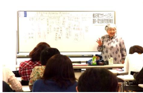
「子どもの発達と生活1」