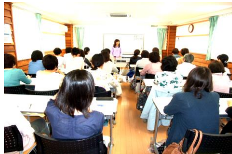
「地域における子育て支援」